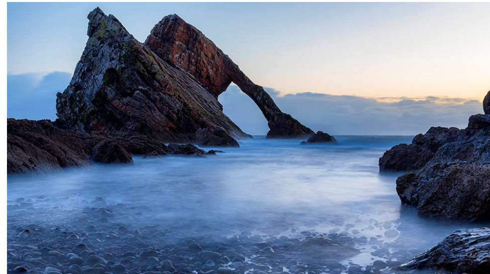
Bow Fiddle Rock

Wir empfehlen unser Clublokal auch für private Feiern: