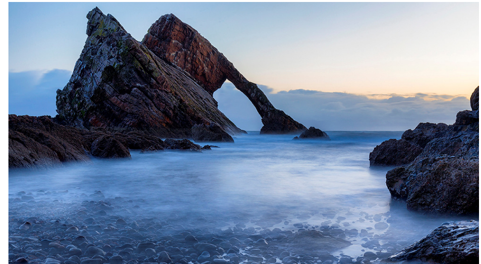
Bow Fiddle Rock

Wir empfehlen unser Clublokal auch für private Feiern: