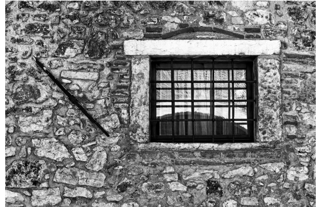
Window, Fotograf: Andreas Pauli

Wir empfehlen unser Clublokal auch für private Feiern: